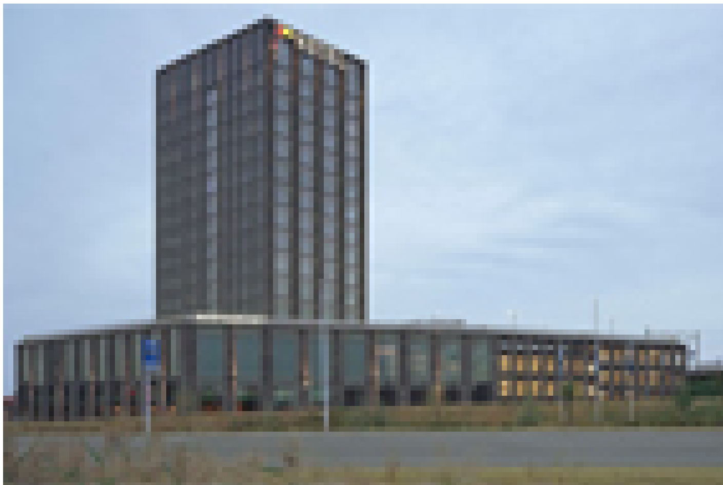
Van der Valk Hotel Nijmegen-Lent **** (Lent)