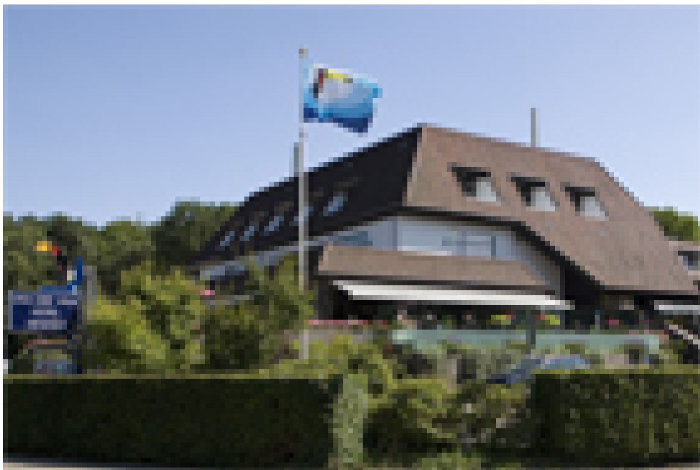
Van der Valk Hotel Arnhem **** (Arnhem)