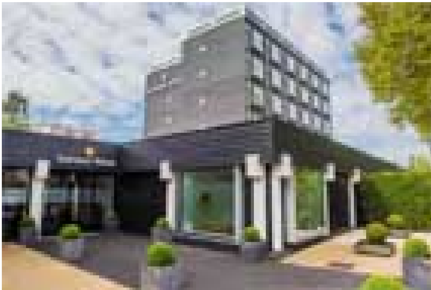
Golden Tulip Zoetermeer Den Haag **** (Zoetermeer)

Quando selezioniamo gli hotel, verifichiamo che abbiano un deposito biciclette sicuro e al chiuso. Tuttavia, questo non è sempre possibile, dipende da hotel a hotel e dal numero di biciclette depositate dagli altri ospiti della struttura.