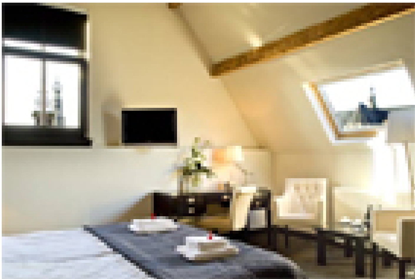
Grand Hotel Alkmaar **** (Alkmaar)