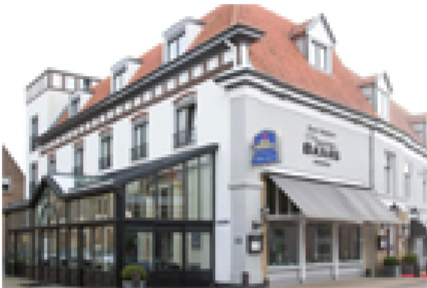
Best Western Hotel Baars ***** (Harderwijk)