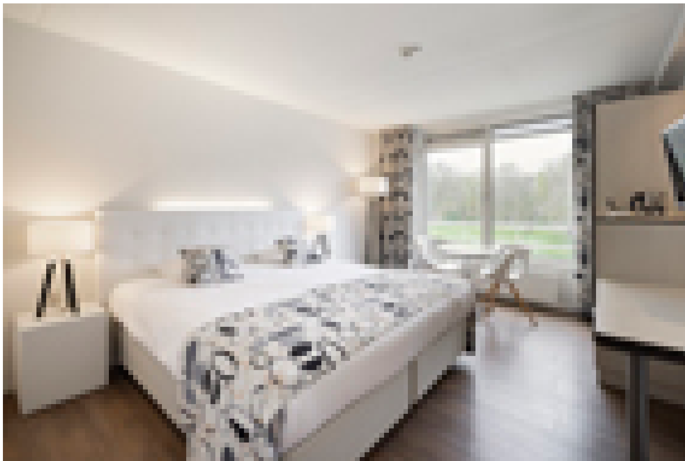
Hotel Mitland **** (Utrecht)

Quando selezioniamo gli hotel, verifichiamo che abbiano un deposito biciclette sicuro e al chiuso. Tuttavia, questo non è sempre possibile, dipende da hotel a hotel e dal numero di biciclette depositate dagli altri ospiti della struttura.