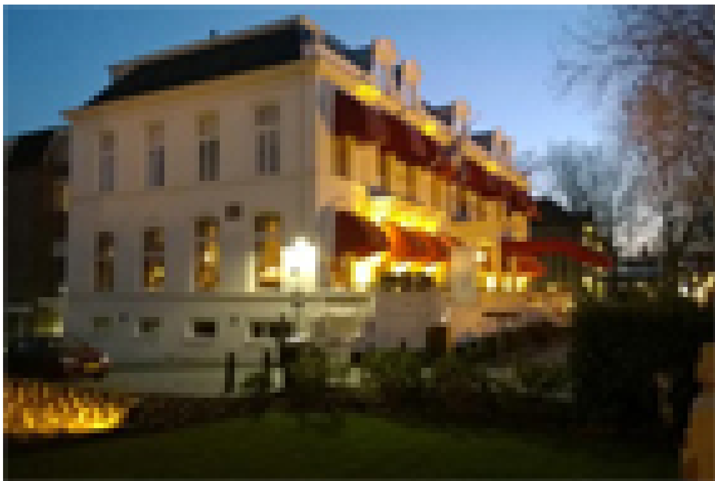
Bilderberg Grand Hotel Wientjes ***** (Zwolle)

www.bilderberg.nl/zwolle/grand-hotel-wientjes