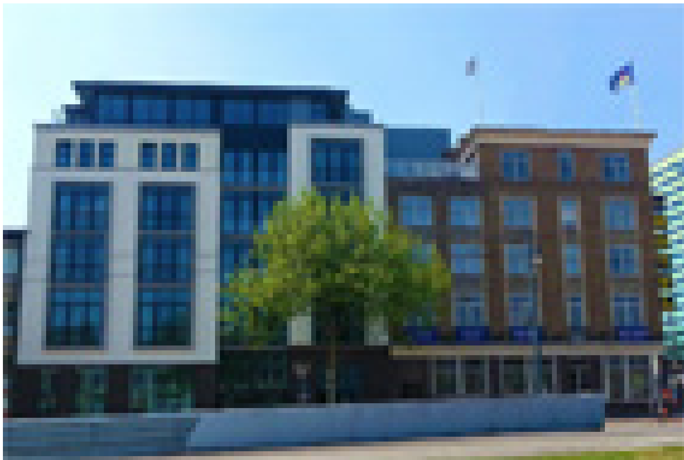
Hotel Haarhuis **** (Arnhem)

Quando selezioniamo gli hotel, verifichiamo che abbiano un deposito biciclette sicuro e al chiuso. Tuttavia, questo non è sempre possibile, dipende da hotel a hotel e dal numero di biciclette depositate dagli altri ospiti della struttura.