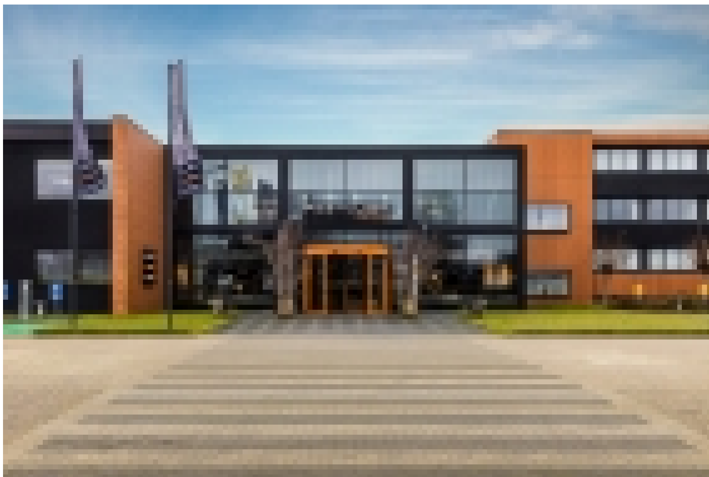
Postillion Hotel Deventer**** (Deventer)

www.postillionhotels.com/postillion-hotel-deventer