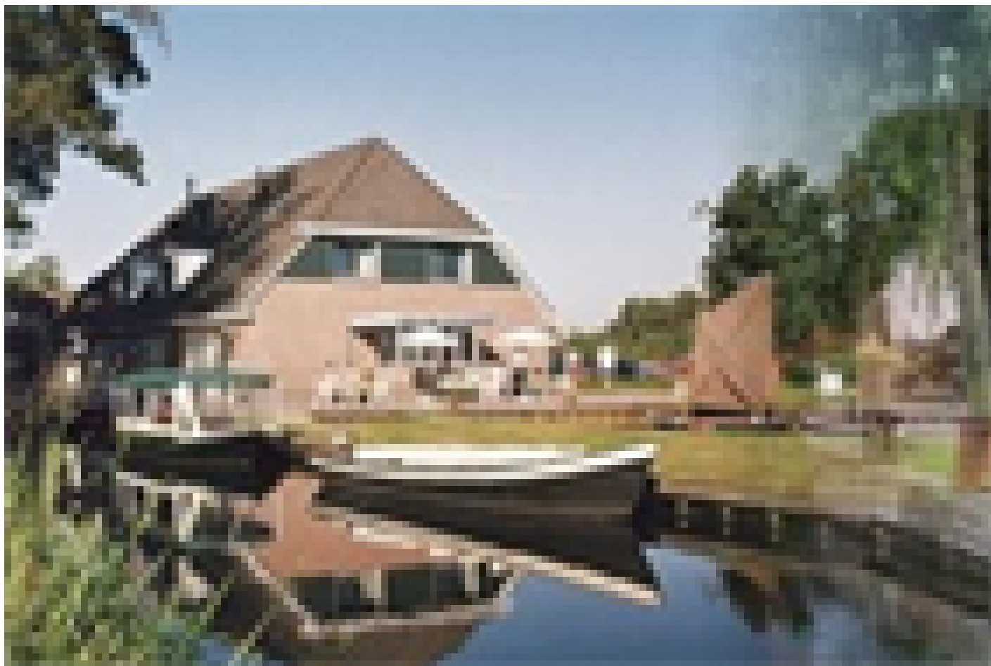
Hotel de Harmonie **** (Giethoorn)

Quando selezioniamo gli hotel, verifichiamo che abbiano un deposito biciclette sicuro e al chiuso. Tuttavia, questo non è sempre possibile, dipende da hotel a hotel e dal numero di biciclette depositate dagli altri ospiti della struttura.