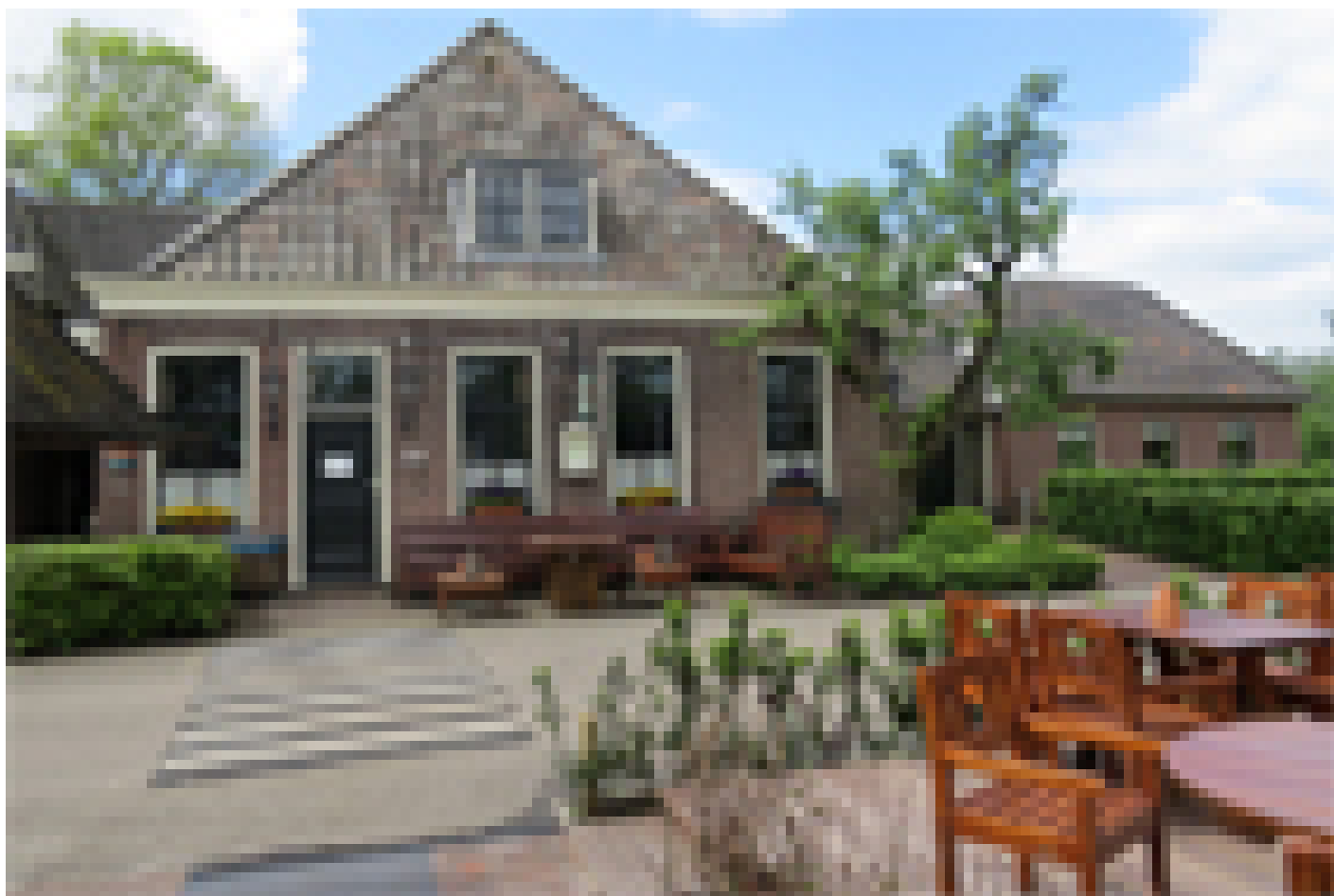
Hotel Geertien *** (Blokzijl)