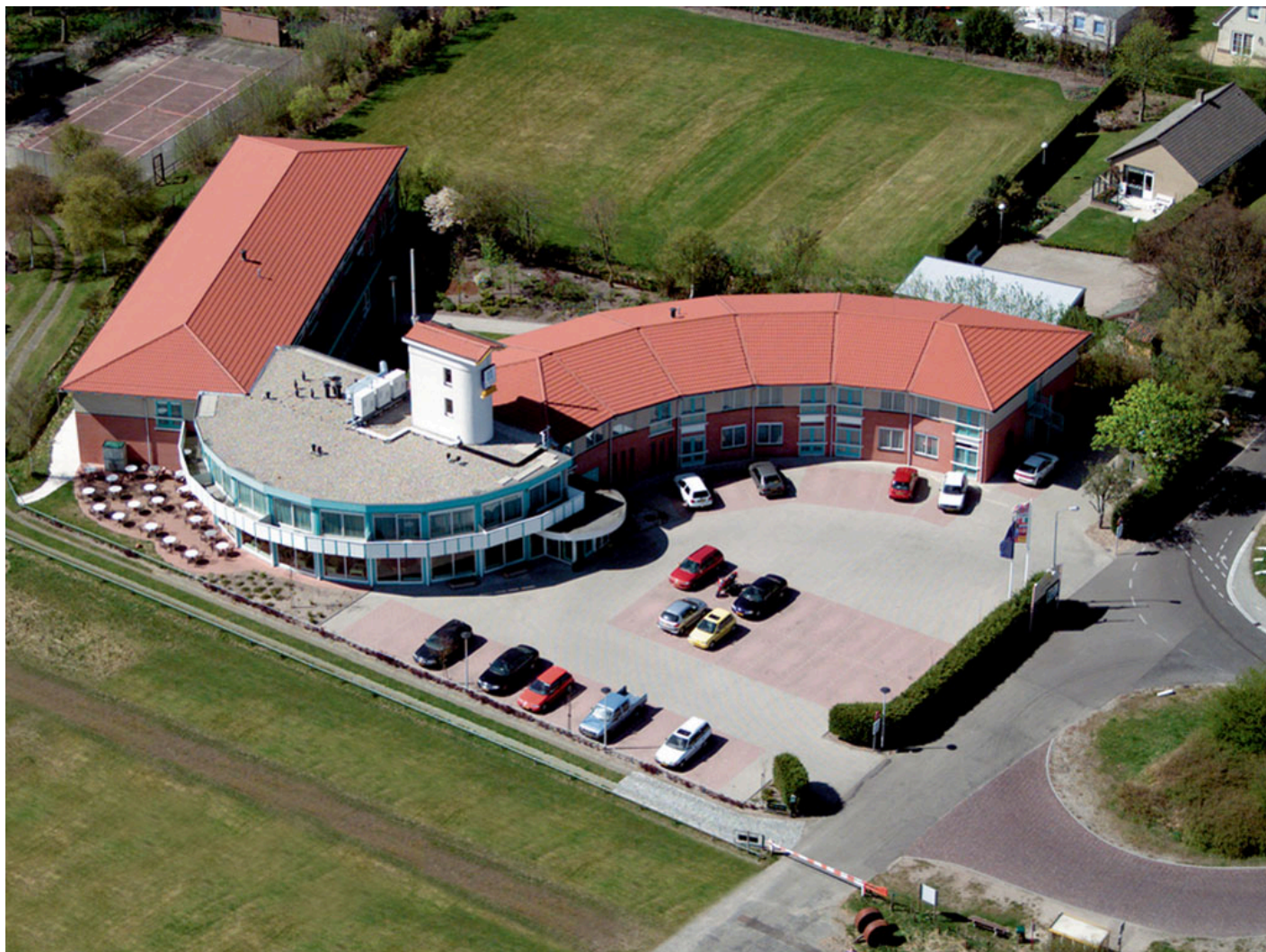
Fletcher Duinhotel Burgh Haamstede **** (Burgh Haamstede)

Quando selezioniamo gli hotel, verifichiamo che abbiano un deposito biciclette sicuro e al chiuso. Tuttavia, questo non è sempre possibile, dipende da hotel a hotel e dal numero di biciclette depositate dagli altri ospiti della struttura.