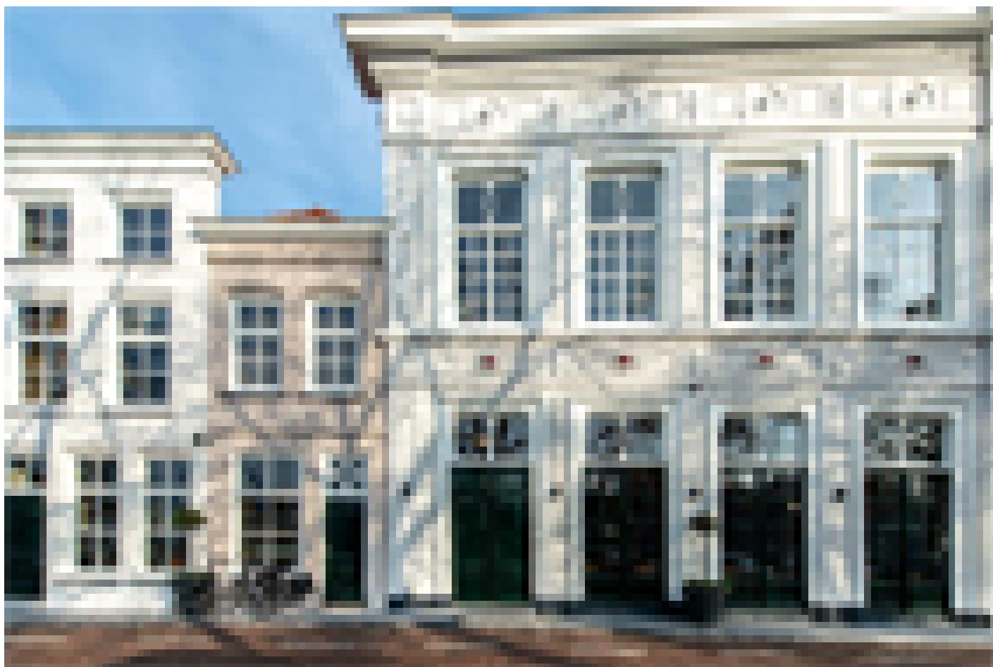
Hotel Mondragon (Zierikzee)